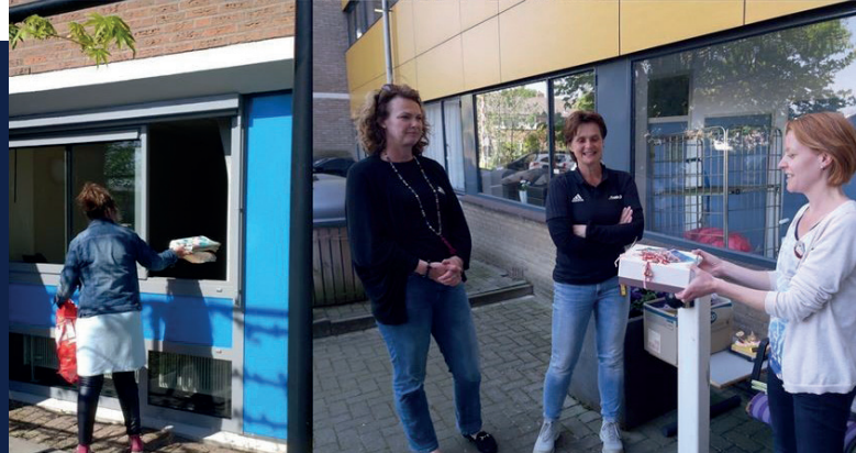
Actie voor Zorggroep Ter Weel