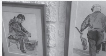
Er komen leuke dingen komen voorbij