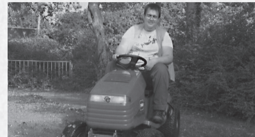
De gras wordt gemaaid