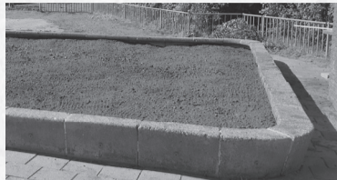
Kale Ruiltuin 1 jaar geleden